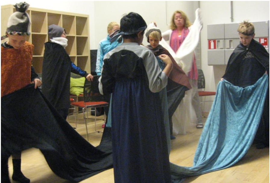
Myndir frá landnámssýningu 5. bekkjar í listasmiðju